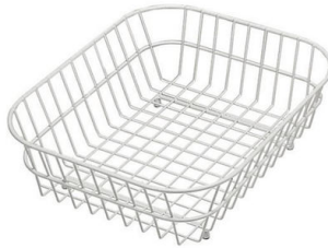
Cesta blanca de acero inoxidable 8612 000